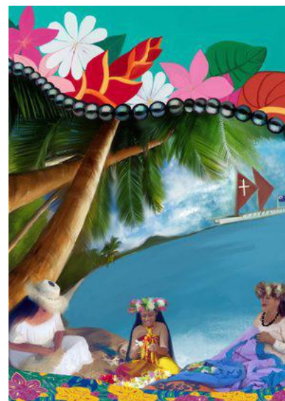
Titelbild 2025 Cookinseln

Machen wir uns also auf zu einer weiten imaginären Reise zu den Frauen, die uns diesen Gottesdienst schenken, und denken daran: «Nähme ich die Flügel des Morgenrotes und liesse mich nieder am äussersten Rand des Meeres, auch dort würde deine Hand mich leiten.» (Psalm 139.).