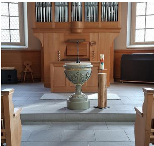
Der Taufstein aus dem Jahr 1888 ist frisch restauriert und steht wieder in der Kirche Wildhaus.